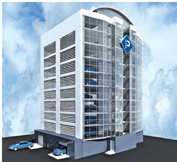
Рис. 7. Пример организации автоматизированного надземного вертикальноориентированного паркинга на 100 машино-мест

Решение этой задачи традиционным рамповым способом часто малоэффективно, а в большинстве случаев и невозможно в силу огромных потерь площади паркинга за счет необходимости применения межэтажных рамп и проездов, ширина которых, напрямую зависит от ширины машино-места (чем уже машино-место, тем шире должен быть проезд для обеспечения комфортного радиуса разворота).