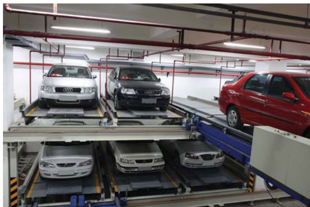
Рис. 1. Автомобили хранятся и перемещаются на палете

Одним из способов увеличения эксплуатационной скорости палетных парковочных технологий является применение автоматической системы обмена палет (рис. 3), которая служит для исключения холостых технологических выбегов системы и как следствие – увеличения эксплуатационной скорости работы паркинга. Однако ее применение значительно увеличивает стоимость парковочной