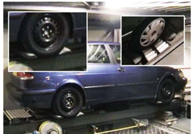
Рис. 4. Вилочный беспалетный транспортный носитель