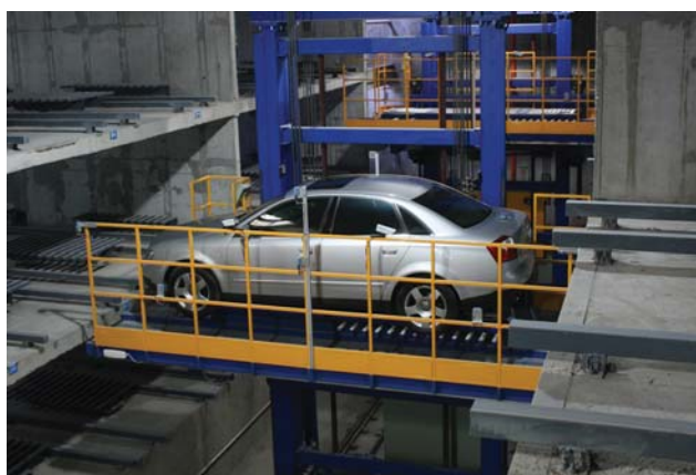
Рис. 6. Гребенчатый транспортный носитель

хранения, за счет возможности использовать под застройку земельные участки, на которых невозможно разместить многоуровневые стоянки из-за их габаритов.