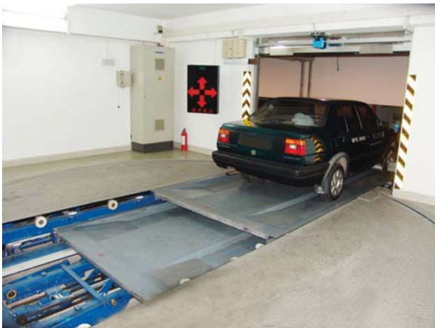
Рис. 3. Автоматическая система обмена палет

Опыт проектирования, строительства и эксплуатации автоматизированных парковочных решений показывает высокую, по сравнению с традиционными подходами экономическую эффективность их применения, которая достигает в среднем 35–40 %. Экономический эффект формируется за счет более плотного размещения машино-мест в автоматизированных паркингах, значительного снижения себестоимости строительства несущих конструкций для формирования многоуровневого объема