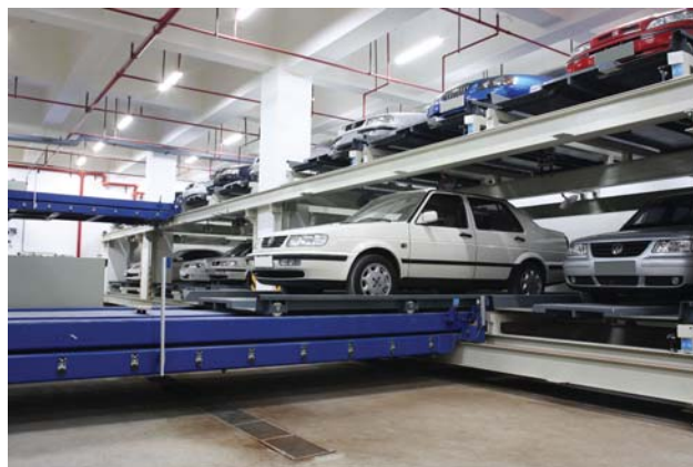
Рис. 2. Перемещение автомобиля на палете с каретки на место хранения